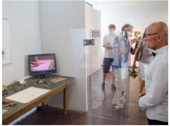
Der Arbeitstisch als Installation.