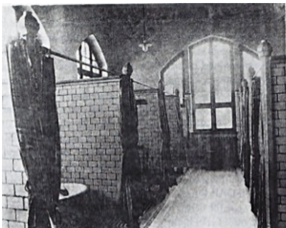
Waschkabinen im Wohlfahrtsgebäude