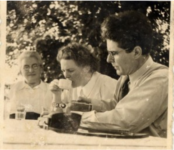
Walter Poller und Frau im Garten beim Kaffeetrinken

Biernat, der nach dem Krieg Landrat des Kreises Unna, Regierungspräsident in Arnsberg, Abgeordneter des NRW-Landtags und NRW-Innenminister werden sollte, ging in den Untergrund und flüchtete übers Rheinland nach Belgien. Im Spätherbst 1933 kehrte er ins östliche Ruhrgebiet zurück und schloss sich der Widerstandsgruppe um Walter Poller an. In der Nacht zum 1. November 1934 verhaftete die Gestapo erneut Walter Poller. Trotz brutaler Folter in der berüchtigten Dortmunder „Steinwache“ verriet er keinen seiner Mitstreiter. Am 29. Juni 1935 wurde Poller wegen „Vorbereitung zum Hochverrat“ zu einer Zuchthausstrafe von vier Jahren verurteilt. Die verbrachte er in Gefängnissen in Münster, Neusustrum, Börgermoor, Plötzensee, Oslebshausen, Celle und dem Moorlager Lührsbockel in der Lüneburger Heide. Danach wurde er erneut verhaftet und über Celle und Dortmund ins KZ Buchenwald gebracht. Seine Erinnerungen fasste Walter Poller in dem Buch „Arztchreiber in Buchenwald“ zusammen. 1940 wurde er aus dem KZ entlassen. Nach dem Krieg wurde Poller erster Chefredakteur der „Westfälischen Rundschau“.