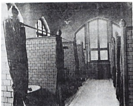
Waschkabinen im Wohlfahrtsgebäude