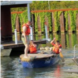
Training für das Fischerstechen