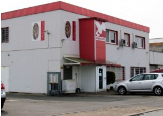
Bäckerei Westermann in Oberaden.