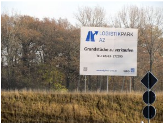
Logistikpark A 2

Gestartet werden soll mit den Bodenarbeiten zur Nivellierung der Fläche. Hierzu ist eine Ausschreibung zur Auswahl der durchführenden Baufirma nötig, welche zur Zeit von der WFG vorbereitet und im Februar durchgeführt wird. Straßen- und Kanalarbeiten sind in diesem Zuge nicht mehr notwendig, da der zweite Bauabschnitt über den bereits vorhandenen Erschließungsstich erreicht werden kann.