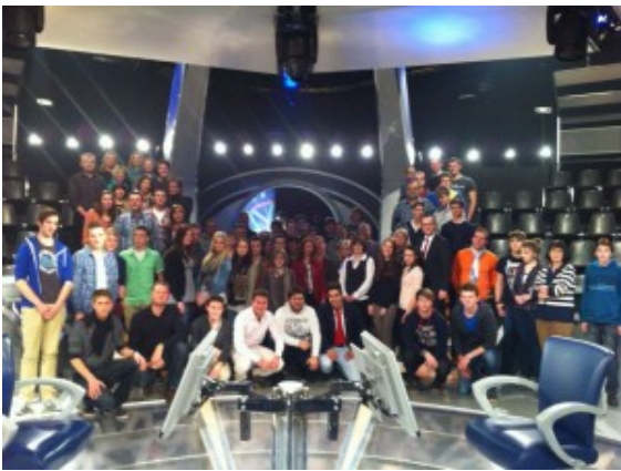
Teilnehmer des Planspiels Börse im Kölner RTL-Studio.