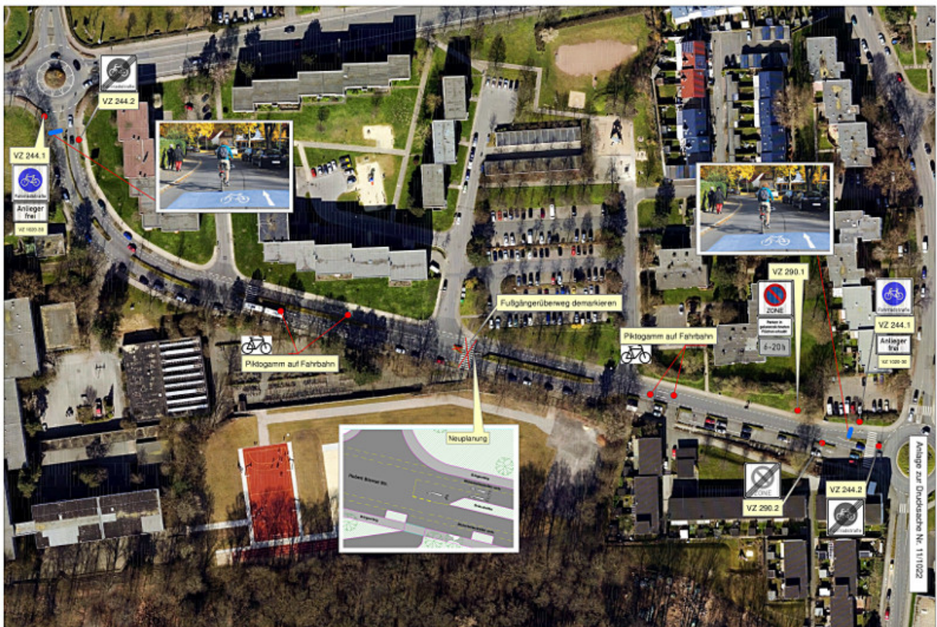
Fahrradstraße: Hubert Biernat Str. M 1:500 25.08.2017