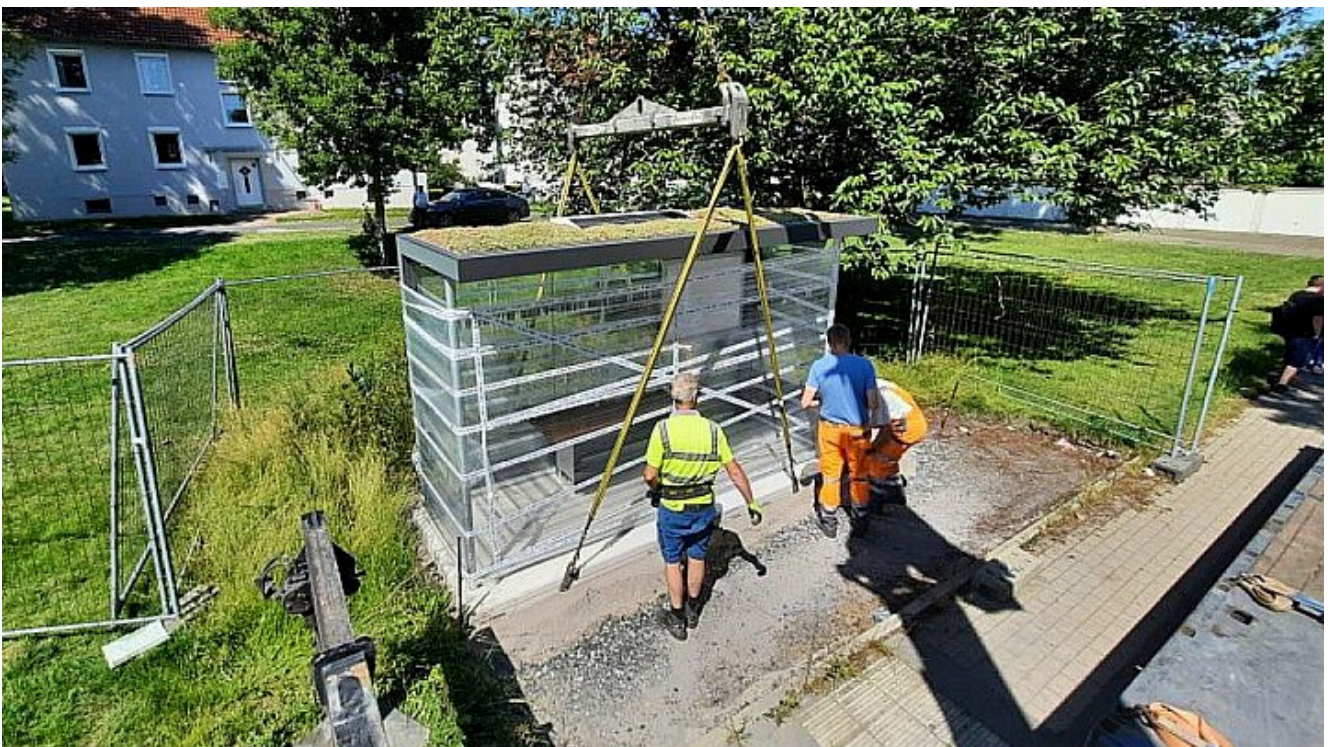
Erste Buswartehalle mit Dachbegrünung und Solarbeleuchtung