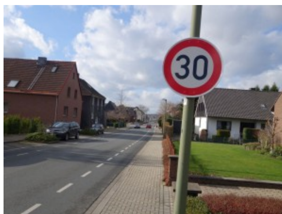
Eins der neuen Tempo 30-Schilder an der Heinrichstraße.

Runter vom Gas wenn es über die Heinrichstraße geht. Nagelneue Tempo 30-Schilder sind dort aufgehängt worden. Wer sie nicht bemerkt, muss mit einem gebührenpflichtigen Foto rechnen.