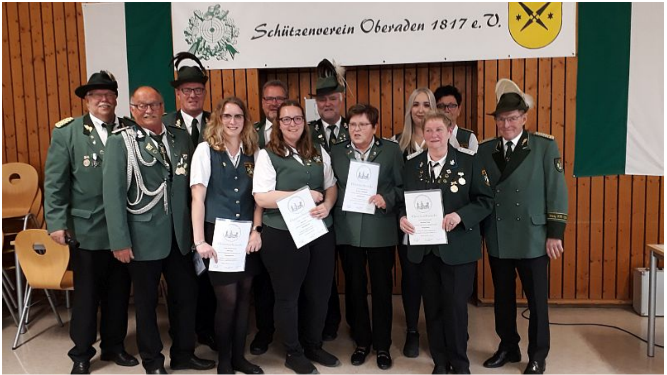
Ehrungen beim Schützenverein Oberaden.

Frühjahrsputz in der Kleingartenanlage „Haus Aden“ und danach Tanz in den Mai