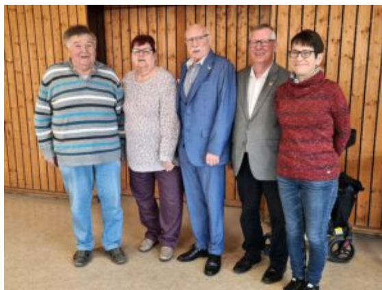
Die Jubilare der Volksbühne 20.

Sonntag, 22.06.2025 um 17:00 Uhr, Einlass 15:00 Uhr