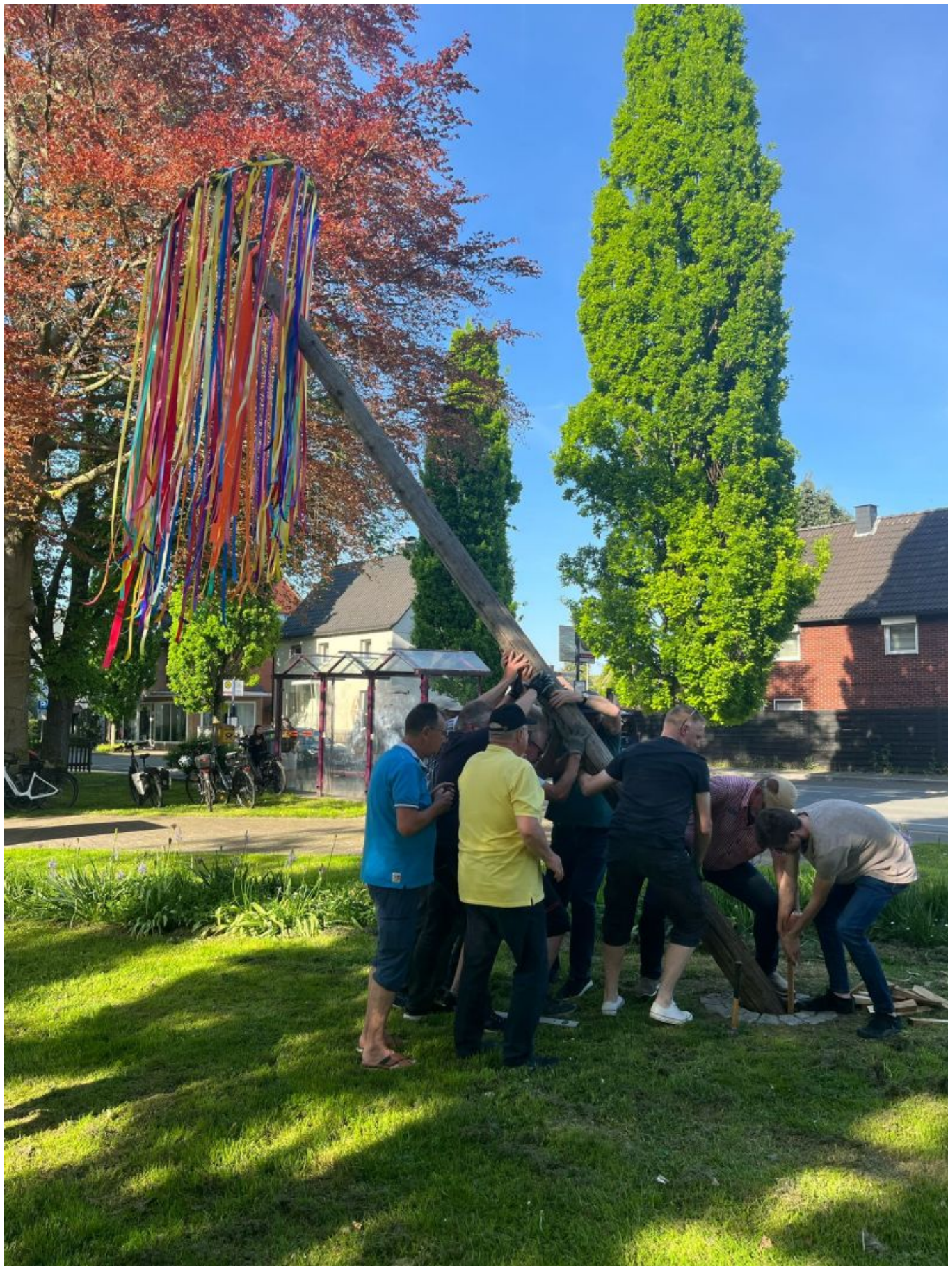
Bei strahlendem Frühlingswetter und bester Stimmung stellte der Verein „Wir in Weddinghofen“ bereits zum vierten Mal den