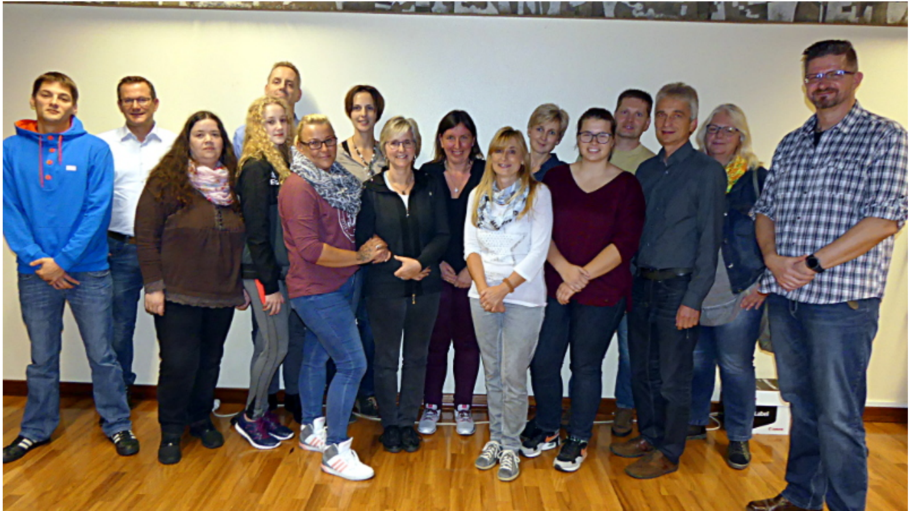
Der neue Vorstand der TuRa-Wasserfreunde.