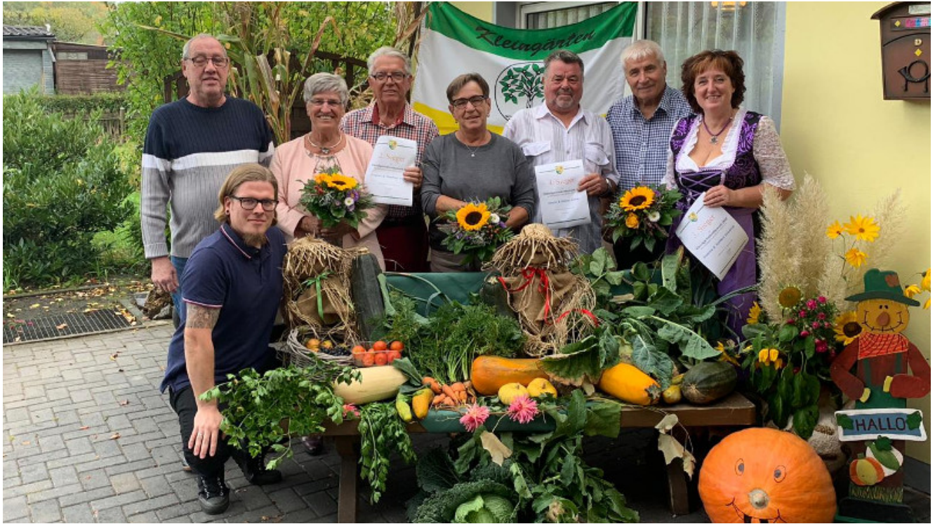
Die Sieger beim Gartenwettbewerb des KGV Haus Aden.

Der Kleingärtnerverein Haus Aden e.V. hat am vergangenen Samstag sein alljährliches Erntedankfest gefeiert, welches in diesem Jahr erstmalig mit einem Kinderkaffee für unsere jungen Nachwuchsgärtner eingeleitet wurde.