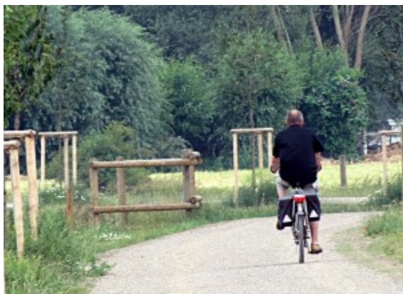
Radeln auf der Sesekestrasse

Die Bergkamener Radler sind mit ihrer Stadt zufrieden, sehen aber auch einige Schwachstellen. Das ist ein Ergebnis des fünften ADFC-Fahrradklimatests, an dem sich Bergkamen erstmals beteiligt hat. 120 Radlerinnen und Radler hatten sich im vergangenen Jahr die Mühe gemacht, einen umfangreichen Fragebogen zur Fahrradtauglichkeit ihrer Heimatstadt zu beantworten.