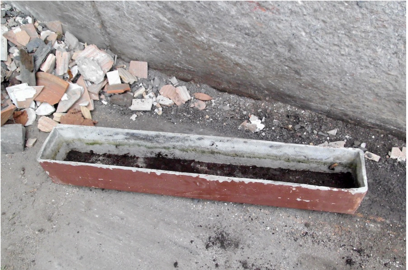
Asbest.