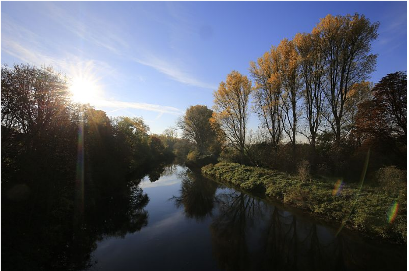
Die Lippe bei Bergkamen.

Wenn die RAG wieder Grubenwasser von Haus Aden in die Lippe leitet, dann muss das Wasser nach einer Forderung des Vereins „Sauber