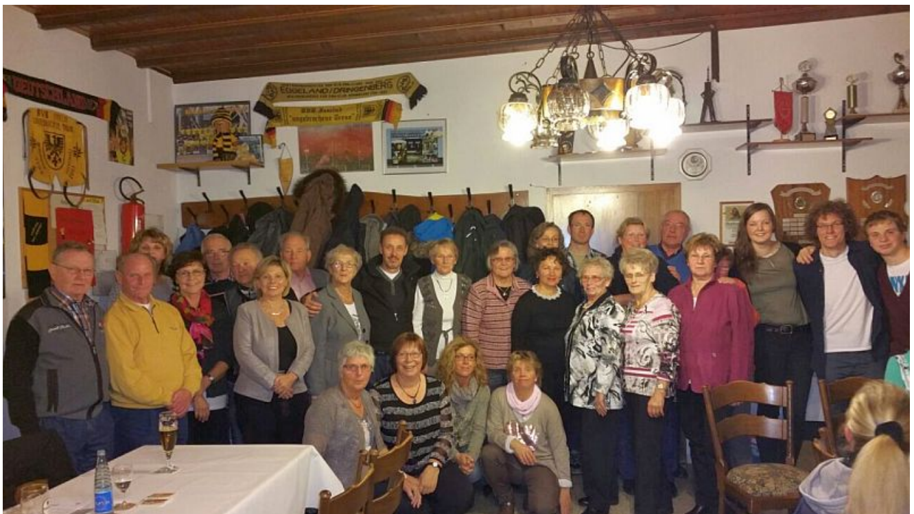
Die erfolgreichen Sportlerinnen und Sportler des TuS Weddinghofen.