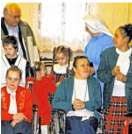
Foto von einem früheren Besuch des Kinderheims in Oberschlesien

Zum 26. Mal startet in der Adventszeit die St. Michael-Gemeinde Weddinghofen ihre Hilfsaktion für das „Heim für behinderte und zum Teil schwerstbehinderte Kinder in Ludwigsdorf“ in Oberschlesien/Polen. Sie bittet alle Bergkamenerinnen und Bergkamener, sie bei diesem Projekt zu unterstützen.