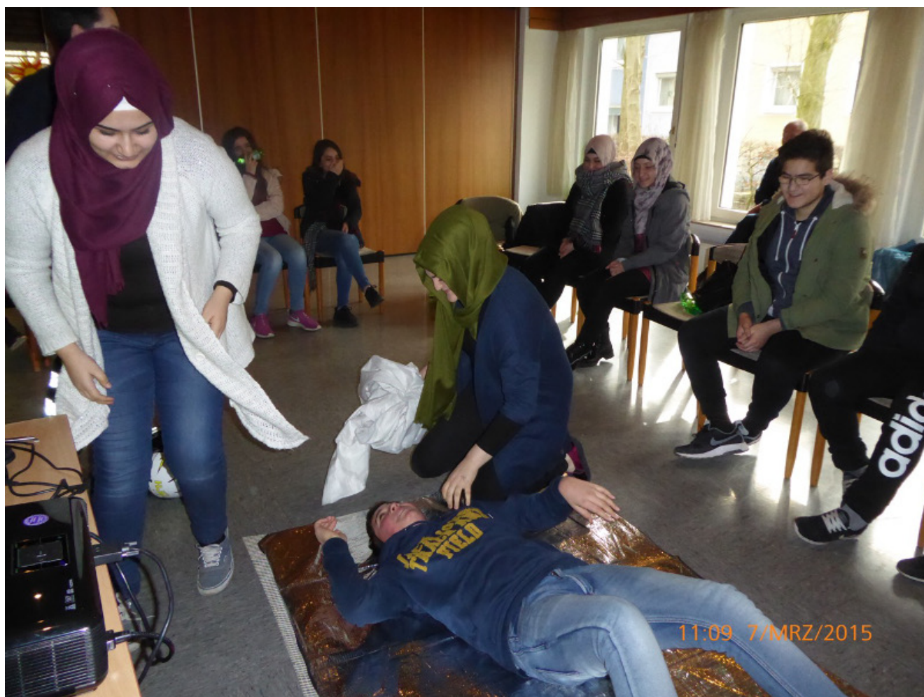
Erste-Hilfe-Lehrgang für junge Migrantinnen und Migranten.

Zum ersten Mal hatte am vergangenen Wochenende der Bergkamener Integrationsrat zu einem Kurs „Verhalten in Notfall- und Unfallsituationen“ am vergangenen Wochenende in Zusammenarbeit mit den Johannitern NRW/Östliches Ruhrgebiet in das ehemalige Klepper-Haus eingeladen. Die Nachfrage war so groß, dass jetzt über einen Zusatzkurs nachgedacht wird.