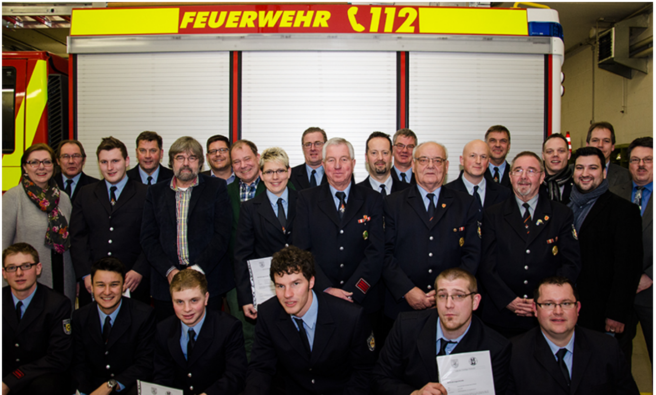
Die Geehrten, Beförderten und Ausgezeichneten auf einen Blick.