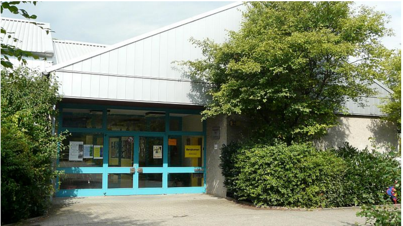
Haupteingang der Gerhart-Hauptmann-Grundschule.

Die Gerhart-Hauptmann-Grundschule wird in Zusammenarbeit mit der AWO Bildung + Lernen zu einem Familiengrundschulzentrum. Das hat der Verwaltungsvorstand um Bürgermeister Bernd Schäfer und auch die Schulkonferenz so beschlossen. Inzwischen gibt es auch den Segen der Schulaufsicht.