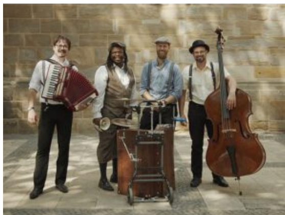
Die LasPolkas-Band sorgt am 30. April für Stimmung

Vereins „Wir in Weddinghofen am Samstag, 30. April, von 15 bis 23 Uhr auf dem Ernst-Fluß-Platz an der Schulstraße.