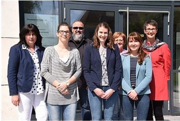
Drei neue Lehrerinnen (vorne in der Mitte) für Holzwickede, Schwerte und Bergkamen vor dem Schulamt für den Kreis Unna.

Grundschulen in Lünen, Schwerte, Bergkamen, Unna und Holzwickede bekommen Verstärkung: Vier neue Lehrerinnen, zwei Sonderpädagogen und eine sonderpädagogische Fachkraft starten im Mai in den Schuldienst. Vertreter der Schulaufsicht für Grundschulen und des Fachbereichs Schulen und Bildung begrüßten die „Neuen“ im Schulamt für den Kreis Unna.