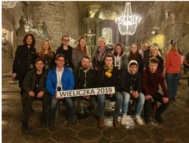
Besichtigung des Salzbergwerks in Wieliczka.