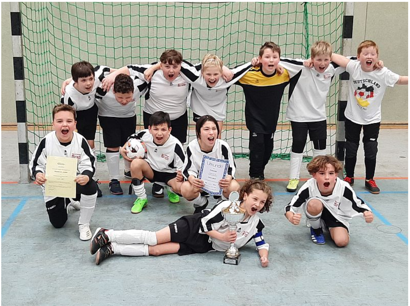
Das Fußballteam der Preinschule.

Fachlich wurden die Wettkämpfe von den Kampfrichtern der Wasserfreunde TuRa Bergkamen, Fußballschiedsrichtern aus dem Kreis Unna/Hamm und durch den SuS Oberaden begleitet.