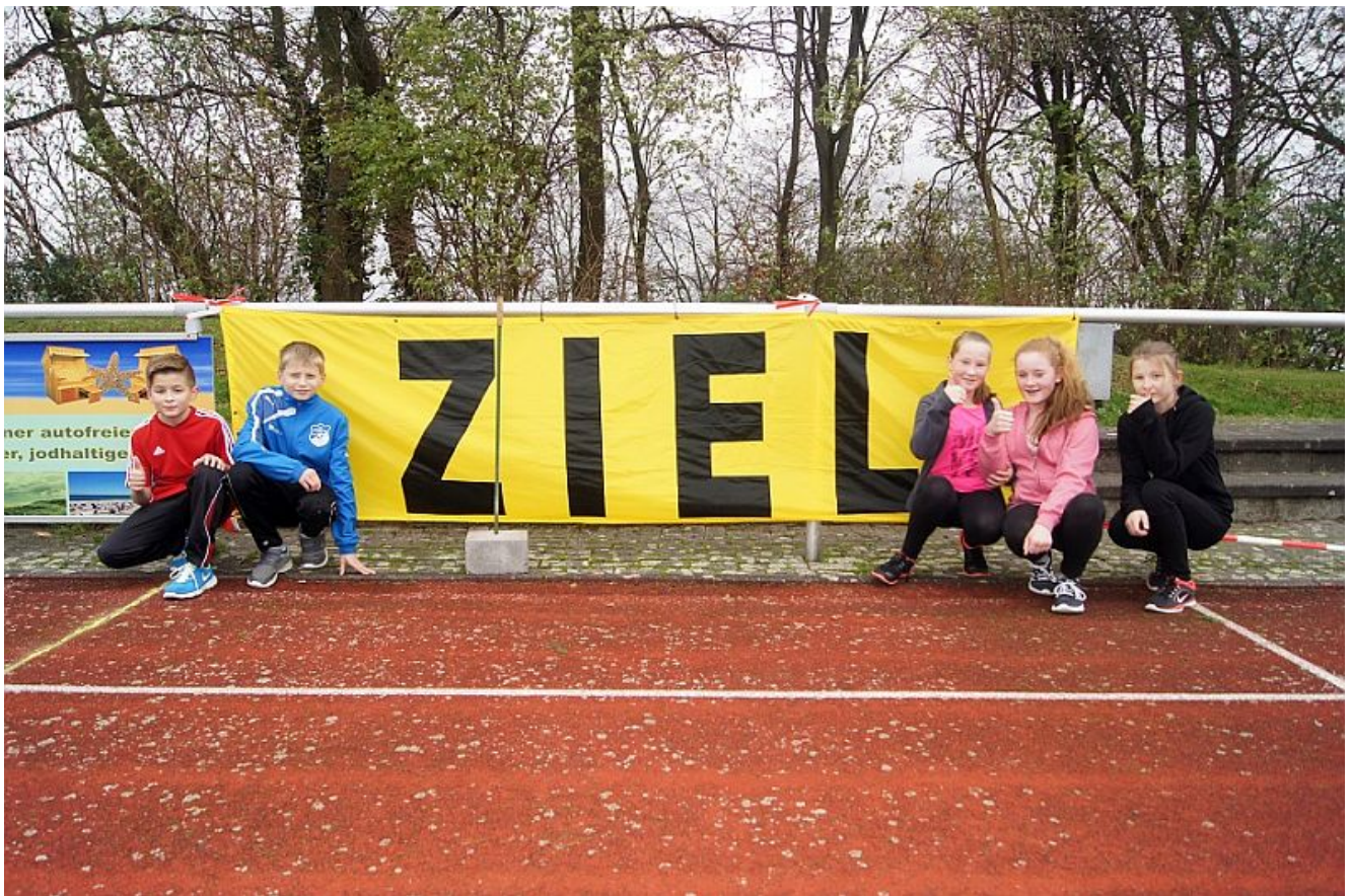
Die fünf „Fitten Füchse“ der RSO beim Barbaralauf 2015

Im kommenden Jahr ist wieder die Teilnahme von deutlich mehr Schülerinnen und Schülern geplant.