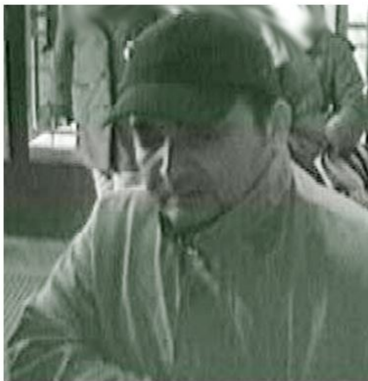
Tatverdächtiger Geldabheber Bergkamen, 07.01.2016