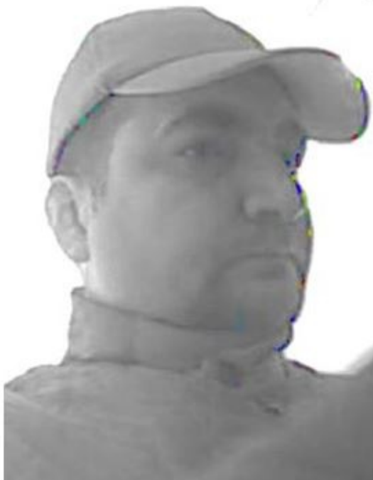
Tatverdächtiger Geldabheber Bergkamen, 05.11.2015

Mit zwei Fotos von Taschendieben auf dem Bergkamener Wochenmarkt bittet jetzt die Polizei die Öffentlichkeit um Unterstützung. Der erste Diebstahl ereignete sich im November vergangenen Jahres und der zweite im Januar dieses Jahres.