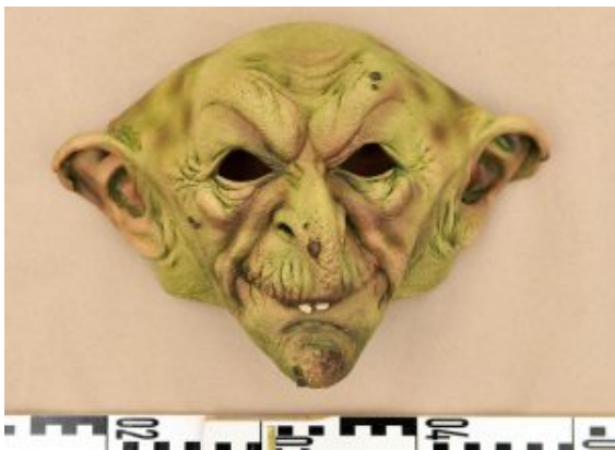
Die Koboldmaske des

Der Tankstellenräuber mit der Koboldmaske, am Abend des 25. März die Tankstelle an der Schulstraße in Weddinghofen überfallen hatte, muss für neun Jahre ins Gefängnis. Dazu verdonnerte ihn am Montag das Duisburger Landgericht.