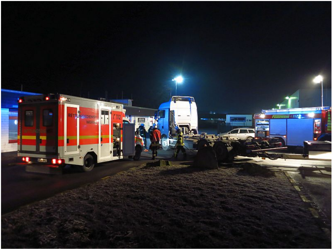
Tödlicher Unfall im Eingangsbereich von Amazon in Werne.

Gegen 6.15 Uhr stand nach Mitteilung der Polizei ein 28-jähriger Lkw-Fahrer aus Bochum mit seinem Fahrzeug vor der Schranke eines Firmengeländes im Wahrbrink. Als er auf das Gelände fahren wollte, stieß er mit dem 72-jährigen Gelsenkirchener zusammen. Der Mann, nach Auskunft der Feuerwehr Werne ebenfalls ein Lkw-Fahrer, ging zu Fuß in Richtung Anmeldung. Durch Rufen hatten einige Mitarbeiter noch auf die gefährliche Situation aufmerksam machen wollen, doch leider zu spät.