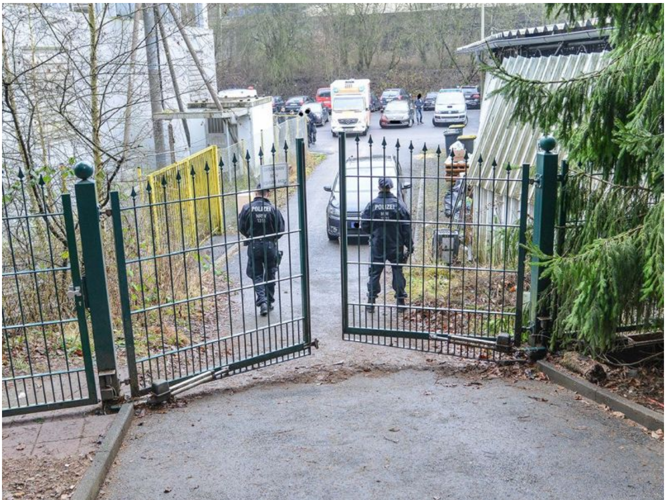
Eingangstor zur angeblichen Hundezucht .

105 Hunde, die Schlimmes bei angeblichen Züchtern in Kreuztal miterlebt haben, sind jetzt von der Polizei gerettet und auf diverse Tierheime in der Region verteilt worden. Die Polizei in Hagen sucht jetzt auch nach Hundebesitzern, die ihre Vierbeiner in Kreuztal erworben haben. Das Foto zeigt das Tor zur angeblichen Hundezucht.