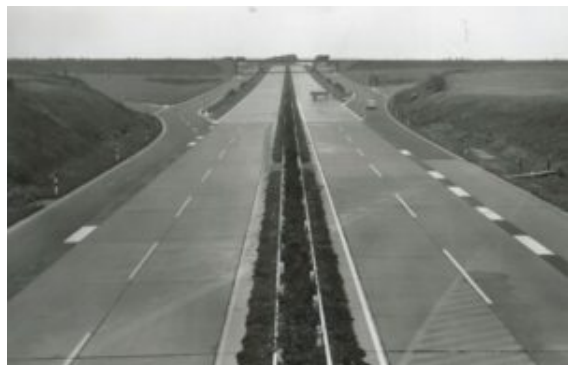
Anschlussstelle Unna-Dortmund wurde vor 60 Jahren fertiggestellt.

Eine Ruhrtangente Kamen – Leverkusen war bereits in den 1930er Jahren geplant. Erste Bauarbeiten im Bereich Unna und Hagen fanden schon vor dem Zweiten Weltkrieg statt. Der Krieg unterbrach die Arbeiten und Planungen jedoch, die erst in den 1950er Jahren mit dem Wirtschaftsaufschwung wieder aufgenommen wurden.