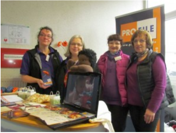
Der Stand des Unternehmerinnen-Netzwerks „Profile“