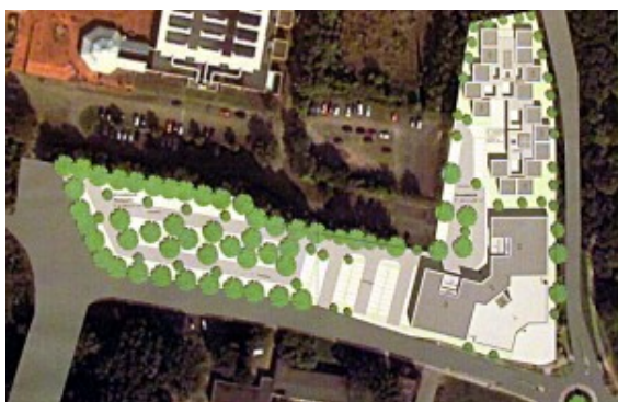
Lagesplan des Gesundheitshauses Bergkamen

Eine Grundlage für preiswerte Praxisräume sind die günstigen Konditionen, zu denen die Püed GmbH inzwischen das Grundstück von der RAG Montan-Immobilien gekauft hat. Im Frühjahr 2014 soll der Bau gestartet werden. Zusätzlich werden auf dem Gelände noch rund 50 Wohnungen entstehen. Vielleicht könne das Gesundheitshaus bereits Ende nächsten Jahres an den Start gehen.