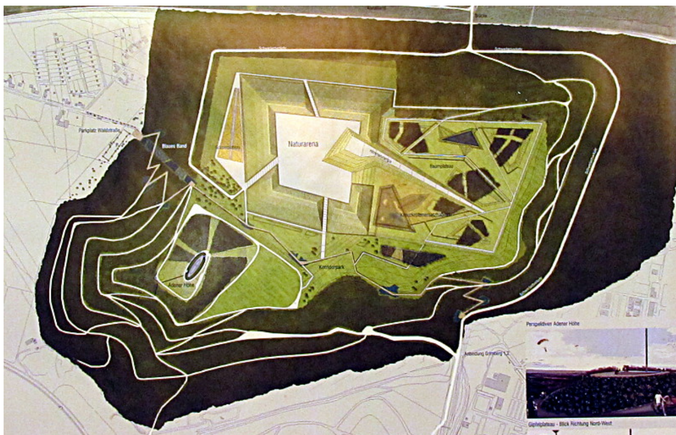
Gestaltungsplan für die Halde Großes Holz.