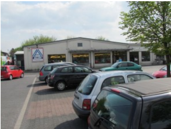
Bisheriger Aldi-Standort am Roggenkamp