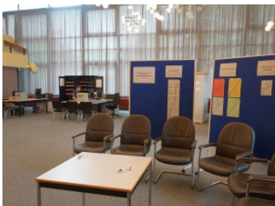
Das Briefwahlbüro im

Wer am 25. Mai, dem Tag der Europa- und Kommunalwahl sowie der Wahl zum Integrationsrat, nicht in Bergkamen ist, kann schon jetzt in diesem Briefwahlbüro seine Stimmen abgeben. Mitbringen sollte man allerdings seinen Personalausweis.