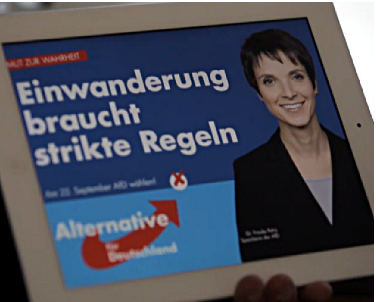
e Petry auf einem AfD-Wahlplakat.