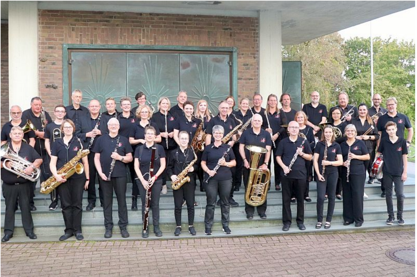
Das Blasorchester Bergkamen (BOB).