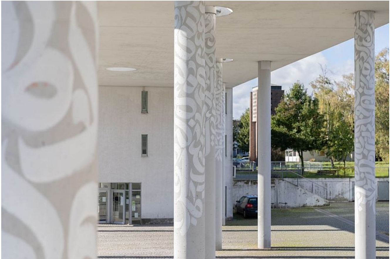
Säulen Daniel ARAB.

Nach dem großen Erfolg im Jahr 2023 setzt das Kunstprojekt ART-HAUS auch 2025 wieder ein starkes Zeichen für zeitgenössische Kunst im öffentlichen Raum. Gefördert durch Neue Künste Ruhr und das Ministerium für Kultur und Wissenschaft des Landes Nordrhein-Westfalen, startet das Projekt am 21.08.2025 und verwandelt den Marktplatz rund um die Stadtbibliothek in eine hochkarätige Galerie im Stadtraum.