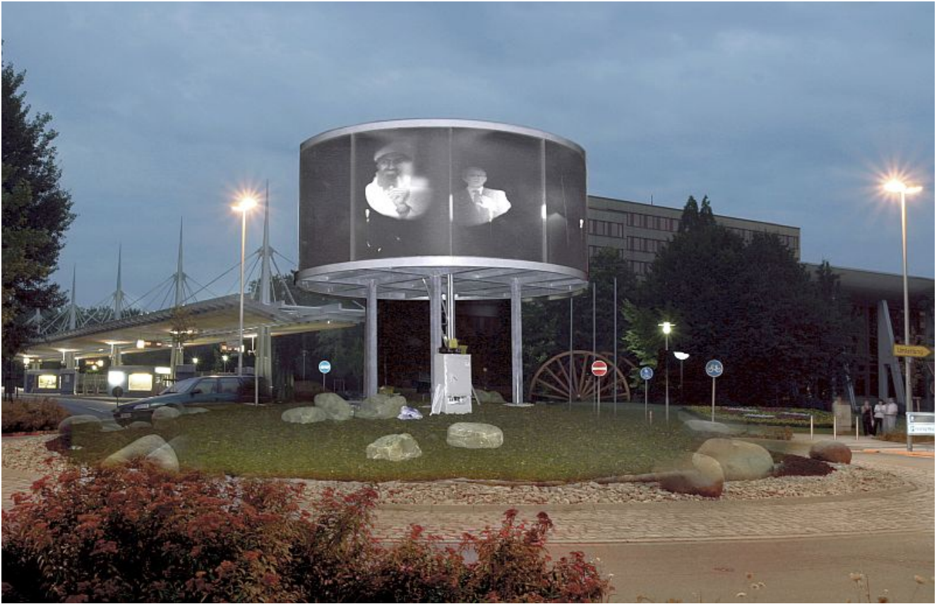
Medienkulptur “no agreement today – no agreement tomorrow” (2004) von Andreas M. Kaufmann.

Ein Spaziergang zur Lichtkunst – ist das Motto der beiden Gästeführungen, die das Kulturreferat am 9. April und 23. April anbietet. Mit den Gästeführern startet der Spaziergang jeweils um 20.00 Uhr vor dem Eingang des Rathauses, Rathausplatz 1 in Bergkamen und führt vorbei an den sechs Lichtkunstwerken im Innenstadtbereich. Die Teilnehmer*innen können sich auf interessante Fakten rund um die Bergkamener Lichtkunst freuen. Wie werden die Bilder der Medienkulptur ausgewählt? Welcher Idee folgten die Künstler, die die Maßstäbe in den Kreisverkehren entworfen haben, und wussten Sie schon, dass Bergkamen einen unterirdischen Flughafen hat? All das und noch vieles mehr, werden Ihnen die beiden Gästeführern auf dem Spaziergang gerne näher bringen. Die