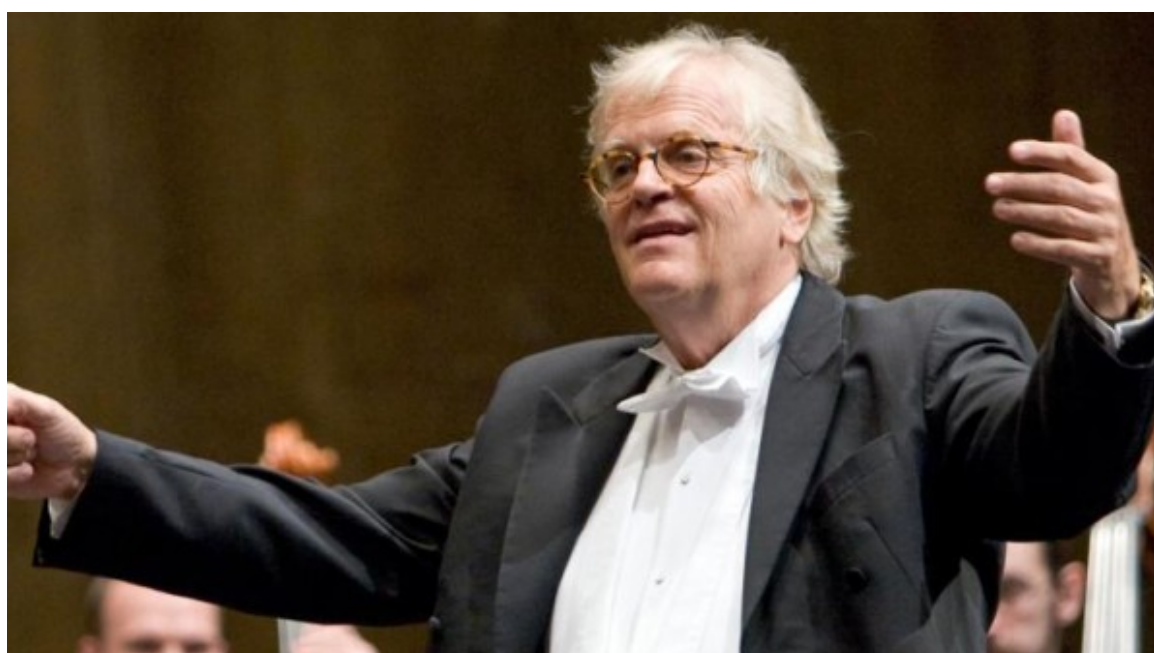
Professor Justus Frantz.