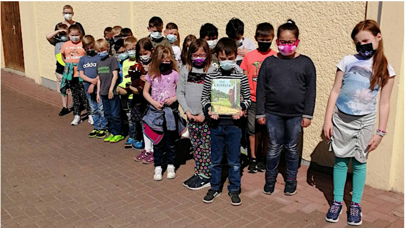
Die Kulturstrolche der Pfalzschule.

Die Wiederaufnahme des Präsenzunterrichts macht auch die Fortführung des Projektes „Kulturstrolche“ möglich. Die Freude darüber war auch bei den Kulturstrolchen der Pfalzschule sehr groß. Und so startete das Projekt direkt am 31. Mai zumindest wieder im Klassenraum.