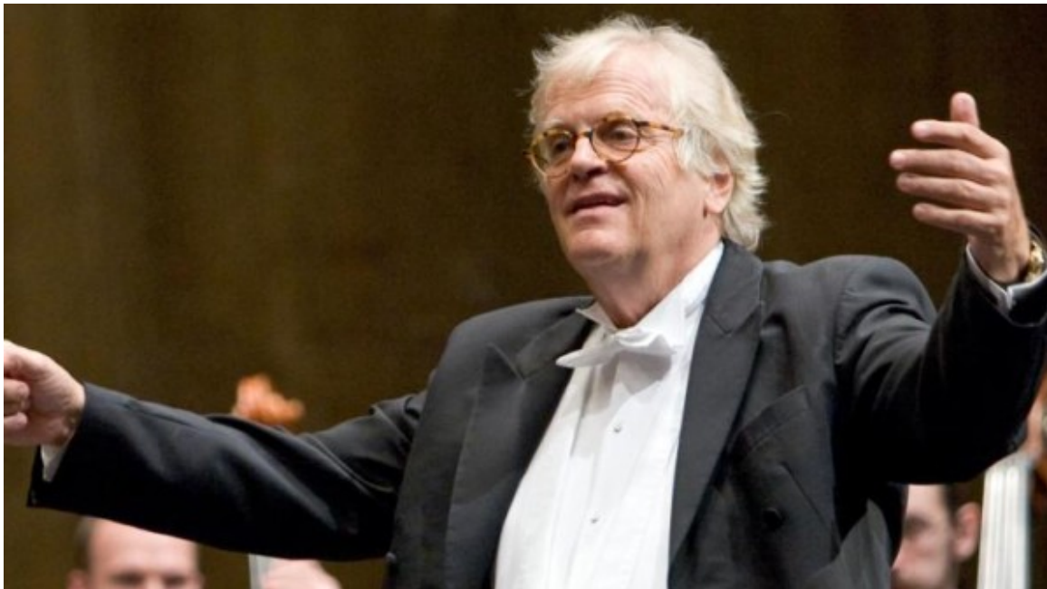
Professor Justus Frantz.

Das Silvesterkonzert 2020 mit der „festival:philharmonie westfalen« musste Corona-bedingt ausfallen. Es wird jetzt am Freitag, 6.. August unter freiem Himmel auf dem Hafenplatz der Marina Rünthe nachgeholt. Allerdings „umsonst und draußen“ ist dieses spezielle Sommerkonzert nicht wie bei den bisherigen Klassik-Konzerten im Rahmen des „Bergkamener Sommers“. Tickets für die auf 224 begrenzten Sitzplätze sollten im Vorverkauf im Kulturreferat erworben und auch bezahlt werden.