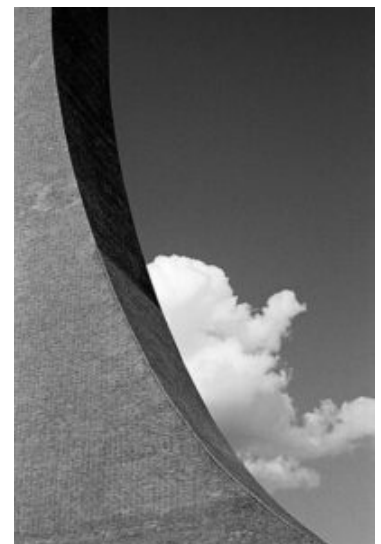
Kersten Glaser: Wolke.

Kersten Glaser wohnt in Bergkamen und studiert Fotografie an der Fachhochschule Dortmund.