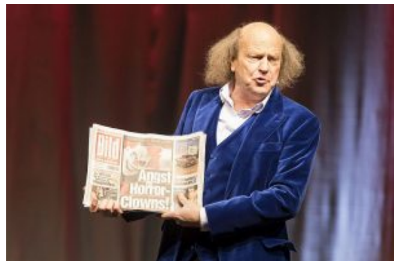
Kabarettist Arnulf Rating.

Wenn er den Koffer voller Zeitungen öffnet, irrwitzige Wortkaskaden ins Publikum feuert, ist klar: Die älteste Rating-Agentur Deutschlands schlägt wieder gnadenlos zu. Am Freitag, den 01.04.2022 um 20.00 Uhr präsentiert Arnulf Rating sein neues Programm „Zirkus Berlin“ auf der Bühne des studio theaters bergkamen.