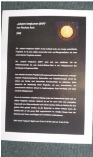
Plakat des Kulturreferats zum „subport bergkamen“