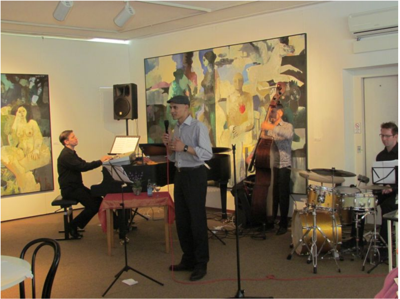
Haryo Sedhono Group