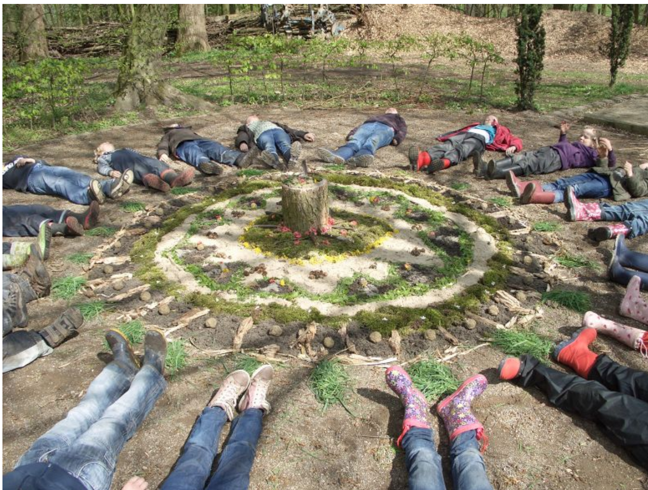
LandArt auf der Ökologiestation

Interessierte Kinder können bei der Jugendkunstschule Bergkamen angemeldet werden. Informationen gibt es unter 02307/9835027 oder 02307/965462.