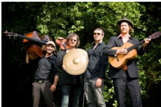
Wuppinger Orchestre l'Europa