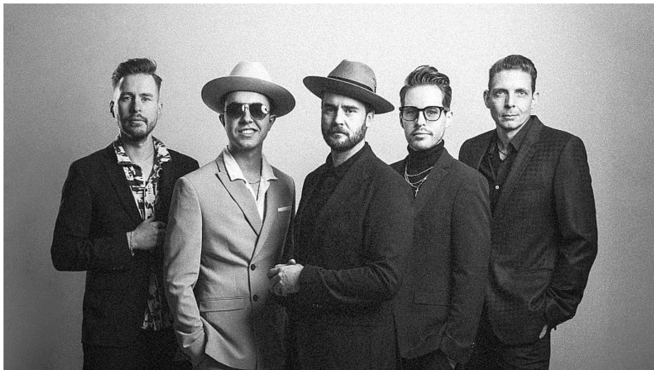
The Bluesanovas.

Der Sparkassen GRAND JAM schließt mit einem letzten großartigen Act am 02.04.2025 um 20.00 Uhr die beliebte Konzertreihe für die Saison 2024/2025 mit der Band „The Bluesanovas“ im Thorheim ab.