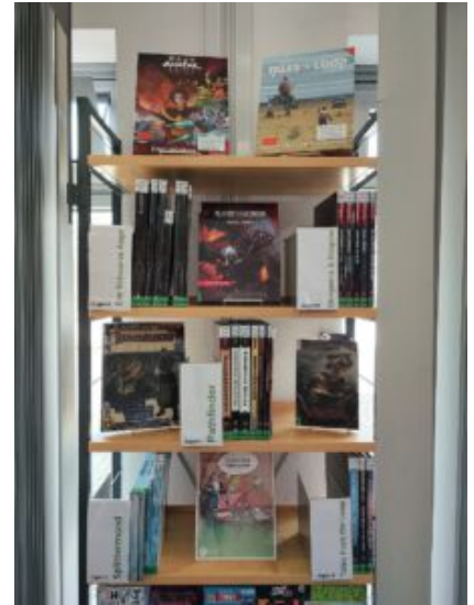
Pen&Paper Regal.

Es wird abenteuerlich! Die Stadtbibliothek Bergkamen bietet nun ein brandneues Pen and Paper Regal an. Dort finden alle Menschen, egal ob jung oder älter, Magier oder Mensch, ein spannendes Abenteuer. Zu den ausgestellten Systemen, Regelwerken und Abenteuern zählen bekannte Reihen wie Dungeons & Dragons , Das Schwarze Auge , Splittermond oder Pathfinder .