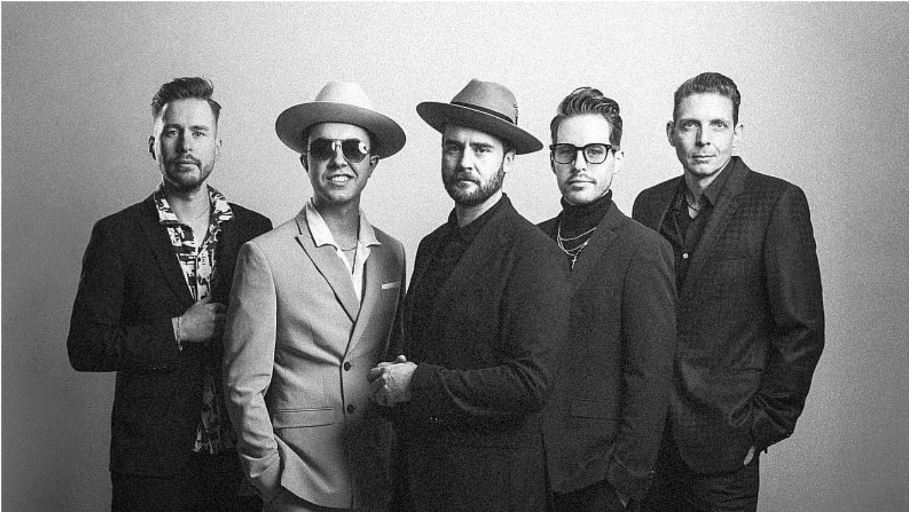
The Bluesanovas.

Der Sparkassen GRAND JAM schließt mit einem letzten großartigen Act am 02.04.2025 um 20.00 Uhr die beliebte Konzertreihe für die Saison 2024/2025 mit der Band „The Bluesanovas“ im Thorheim ab.