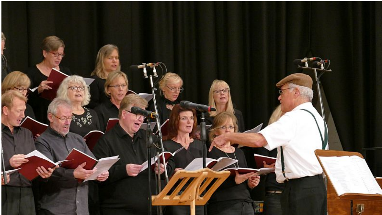
Der Chor „Die letzten Heuler“

Der immer noch quicklebendige Kamener Chor ‚Die letzten Heuler‘ wurde vor exakt 35 Jahren als ‚Chor der Kamener