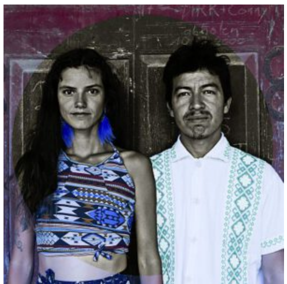
Duo Riosenti.

Zum Auftakt der Veranstaltungsreihe Klangkosmos Weltmusik darf sich das Publikum am Montag, 11. September um 20.00 Uhr im Trauzimmer Marina Rünthe auf das Duo Riosentí freuen. Das Duo Riosentí ist ein Musikprojekt in der großen Tradition lateinamerikanischer Liedermacher und präsentiert Lieder von Wanderschaft, Liebe, Ankommen, Heimat und Fremde.