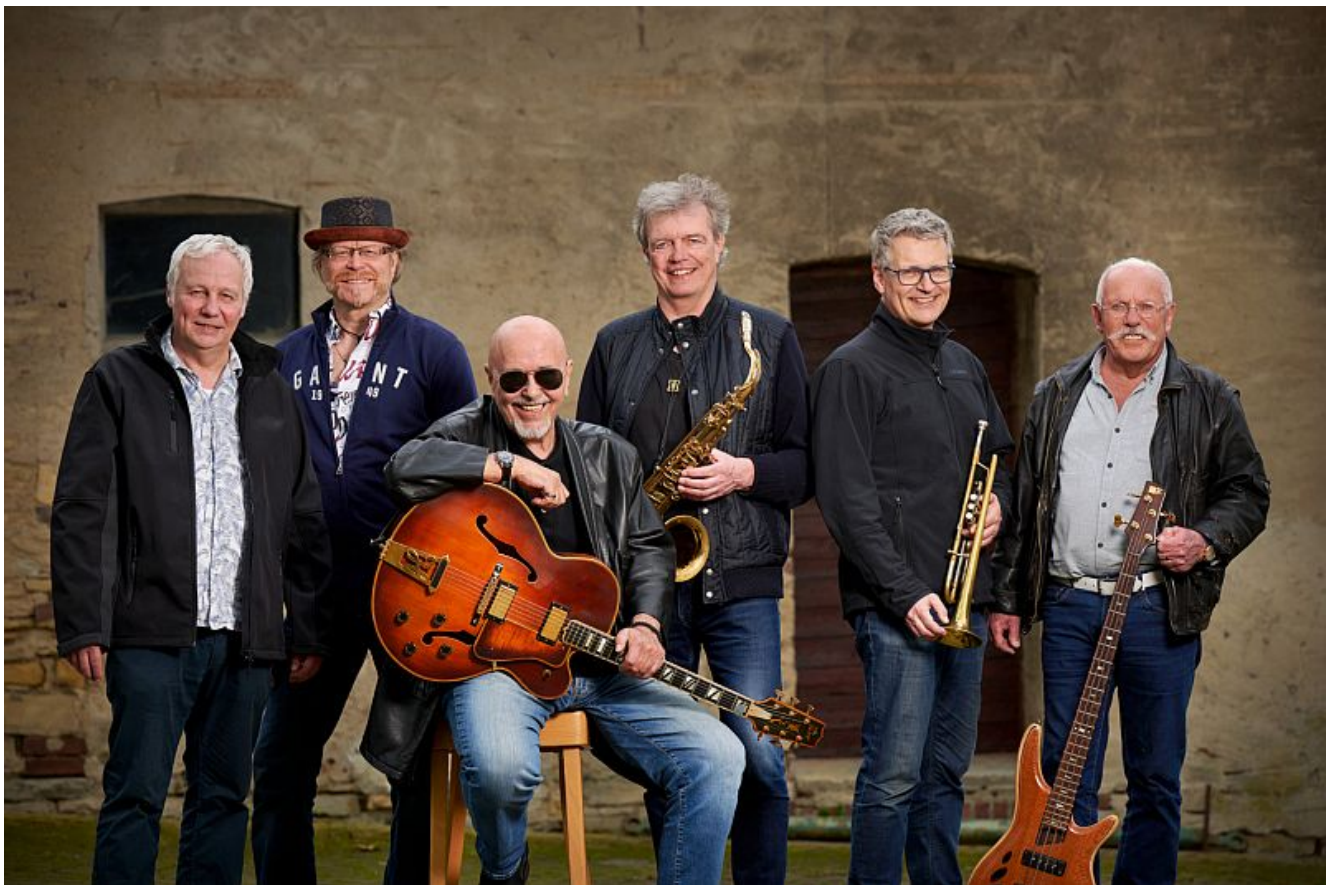
T's Soultrain