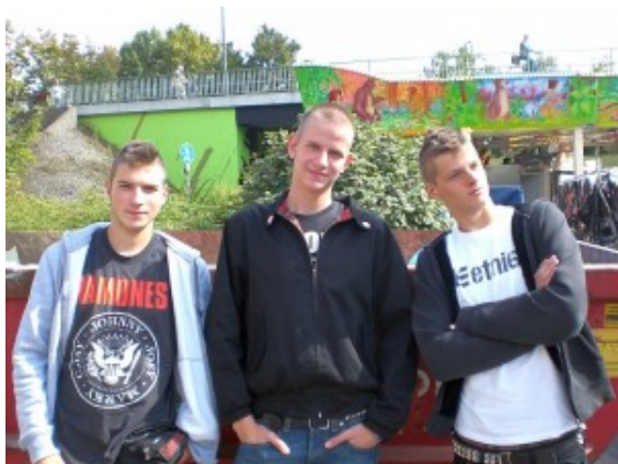
Die Lünener Band „Meals on Wheels“

Im Oberadener Jugendzentrum Yellowstone steigt am Freitag, 31. Januar, um 20 Uhr das erste Vorrundenkonzert von „Ruhr Tour Live 2014“. Am Start ist auch die Bergkamener Band „Nazca Lines“.