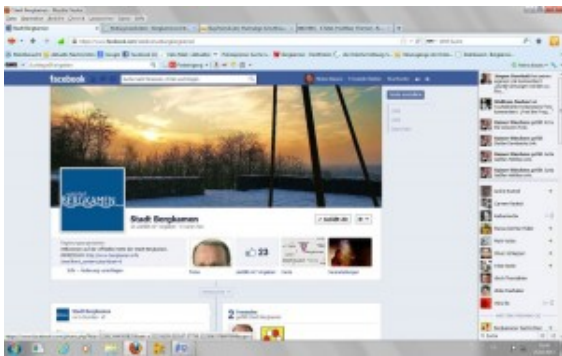
Offizielle Facebook-Seite der Stadt Bergkamen

Lange hat sich ja die Rathaus spitze geziert, doch jetzt ist es passiert: Die Stadt Bergkamen hat eine eigene „offizielle“ Facebookseite. Am Montagmorgen ist sie an den Start gegangen. Das Titelbild ist eine Winterimpression von der Bastion auf der Ader Höhe mit Blick auf die untergehende Sonne.