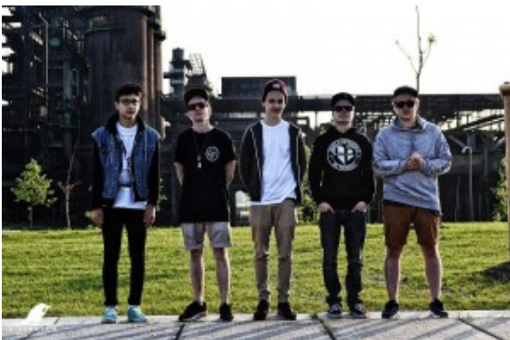
The Watergate Affair

„ Nazca Lines “ proben im Jugendzentrum Yellowstone und haben quasi ein Heimspiel. Sie sind eine 5-köpfige Band aus Bergkamen, deren Mitglieder bereits durch ihre Darbietungen in diversen anderen Bands fest in der lokalen Musikszene verankert sind. Musikalisch sind sie im Screamo der 90er Jahre anzusiedeln und bieten dem Zuschauer sowohl akustisch als auch optisch ein konzeptuelles Trauma, das zum Nachdenken anregt.