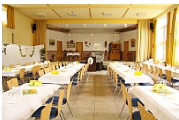
Saal des Martin-Luther-Hauses

Zum zweiten Mal verwandeln die Hobbyschauspieler der „Volksbühne 20“ Oberaden im April das Martin-Luther-Haus in einen Theatersaal. Sie präsentieren dort ihr neues Stück „Hilfe die Griechen kommen“.