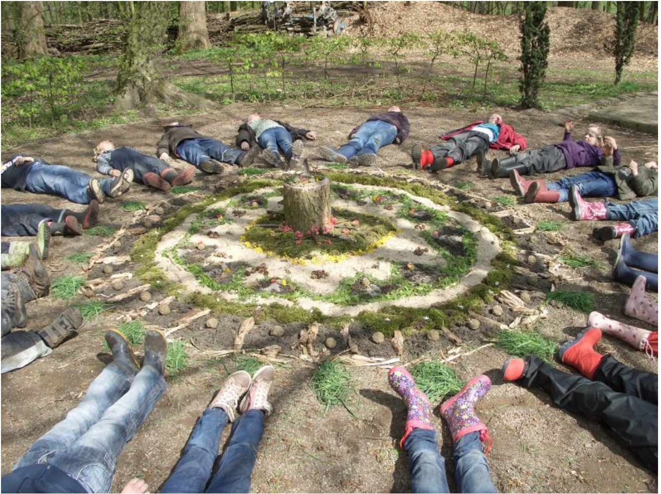
LandArt auf der Ökologiestation