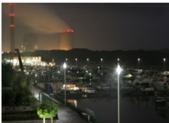
„Marina Pulslicht“ von Mischa Kuball

Die CDU lässt nicht locker. Dass ihre Ratsfraktion zumindest von Teilen der Bergkamener Lichtkunst nicht viel hält, hatte sie bereits in früheren Jahren immer wieder erklärt. Eine ihrer Forderungen war zum Beispiel, auf den Bau der Lichtstele „Impuls“ auf den Bergehalden zu verzichten und die bereits zugesagten Fördergelder an das Land zurückzugeben.