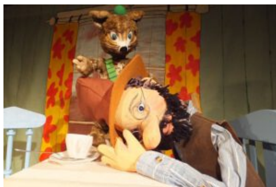
Pettersson und Findus.

Mehr als ein Dutzend Kindergärten in Bergkamen hatten in den letzten Tagen besonderen Besuch: Kreative Puppentheater-Ensembles haben dort mitreißende Geschichten zum Leben erweckt – voller Mut, Tapferkeit und innerer Stärke. Mit jeder Menge Fantasie im Gepäck ziehen die Puppenspieler*innen weiterhin durch die Kitas der Stadt und zaubern den kleinen Zuschauer*innen ein Strahlen ins Gesicht. Das Puppenfestival ist noch bis zum 23.05.2025 in der Stadt.