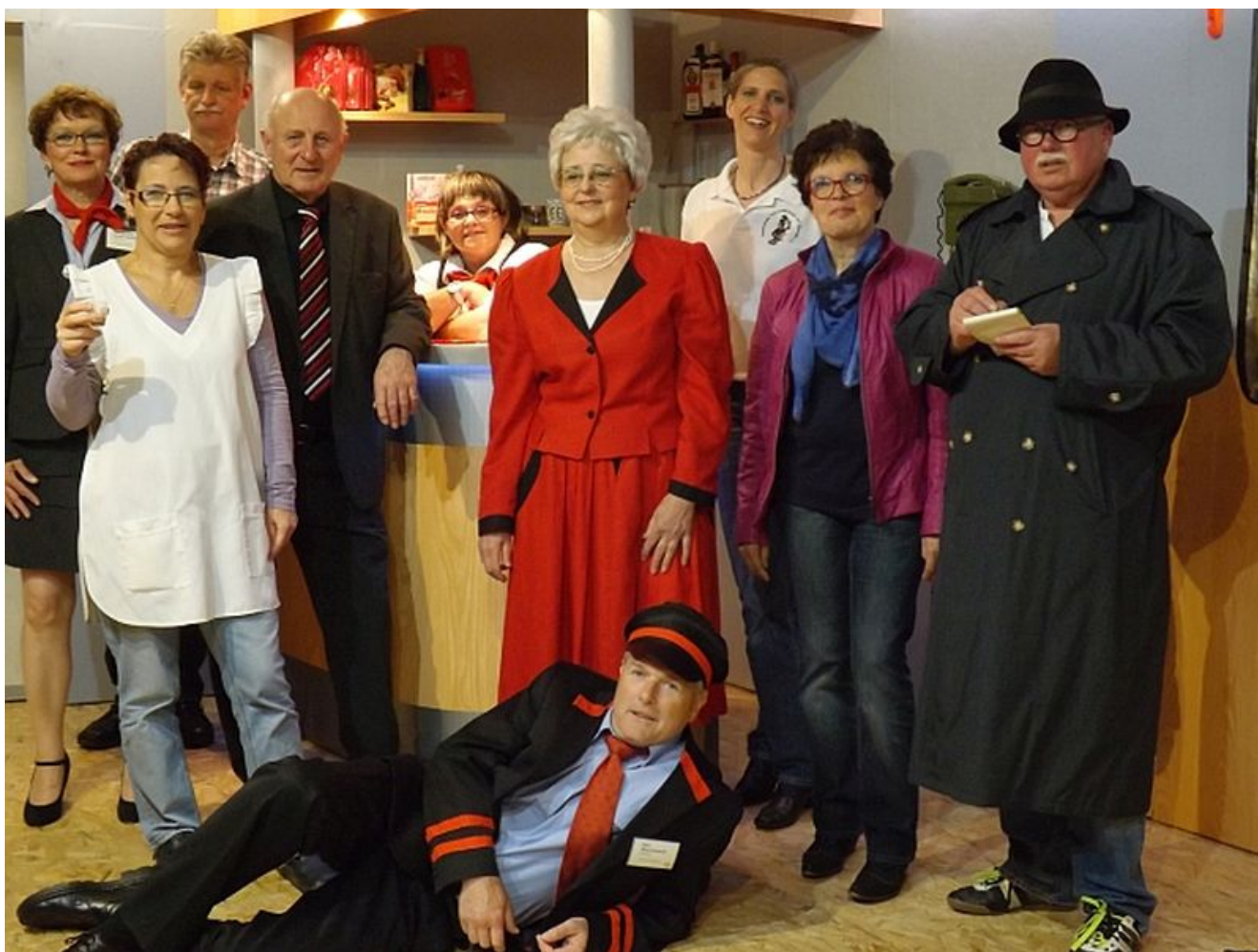
Schaupielker der Volksbühne 20.

Die neue Herbst-Spielzeit hat begonnen. Nach den ersten Lesungen für das neue Stück des Theatervereins Volksbühne 20 „Castinglust und Rollenfrust“ steht fest: Bei der schrillen Beziehungskomödie von Hans Schimmel werden alle denkbaren Klischees bedient, von der Ehekrise, dem Fernsehkitsch bis hin zum Wohlstandsschmarotzer. Die Premiere des Stücks ist am 17. Oktober 2015, um 18:00 Uhr im Martin-Luther- Haus in Bergkamen-Weddinghofen.