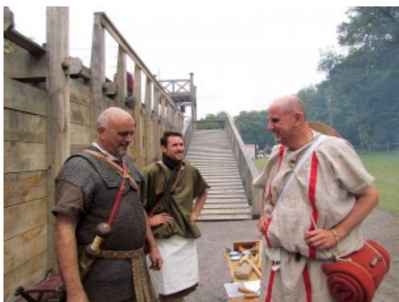
Eine Station des Rundgangs

Letztmalig in diesem Jahr lädt der Bergkamener Gästeführerring interessierte Bürgerinnen und Bürger am Sonntag, 10. November, dazu ein, im Stadtteil Oberaden den Spuren der „alten Römer“ zu folgen.