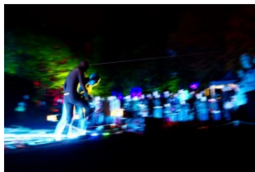
Akrobatik im Wäldchen.

Doch den meisten Besuchern gefiel es. Mystisch und zauberhaft wie immer war der beleuchtete Stadtwald, der sich während des Lichtermarkts immer in einen Märchenwald verwandelt. Großartig auch das Duo „Royal sQueueze Box“, das auf der Ebertstraße Queen-Songs schmetterte. Und ein Volltreffer waren auch die kostenlosen Bus-Touren zu den Lichtkunstwerken im öffentlichen Raum: Die Interessierten quetschten sich regelrecht in die Busse.