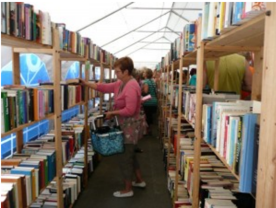
Buchtauschbörse auf dem Bergkamener Wertstoffhof

Auch 2014, voraussichtlich im Sommer, wird es auf dem Bergkamener Wertstoffhof wegen des großen Erfolgs wieder eine GWA-Buchtauschbörse geben. Allein hier haben 6800 Bücher in diesem Jahr auf diesem Weg eine neue Besitzerin oder Besitzer gefunden. Kreisweit waren es 2013 über 14.000 Bücher und seit dem Start dieser Aktion 1996 über 160.000.