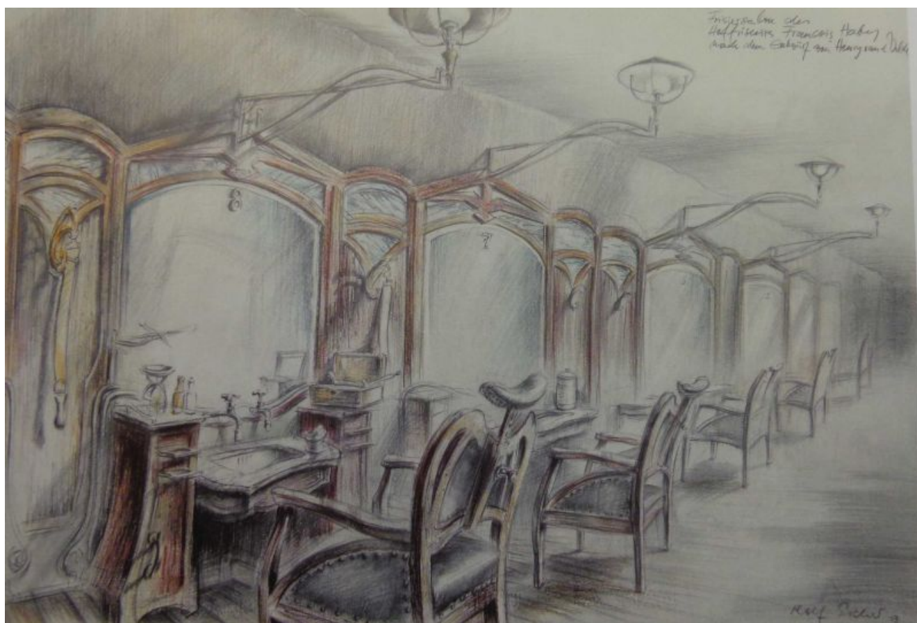
Salon des Berliner Hoffriseurs Francois Haby

„Erinnerungsräume von Berlin bis Venedig“ lautet der Titel der neuen Ausstellung der städt. Galerie „sohle 1“ mit Zeichnungen und Druckgraphiken des Künstlers Rolf Escher, die am Freitag, 28. Februar eröffnet wird.