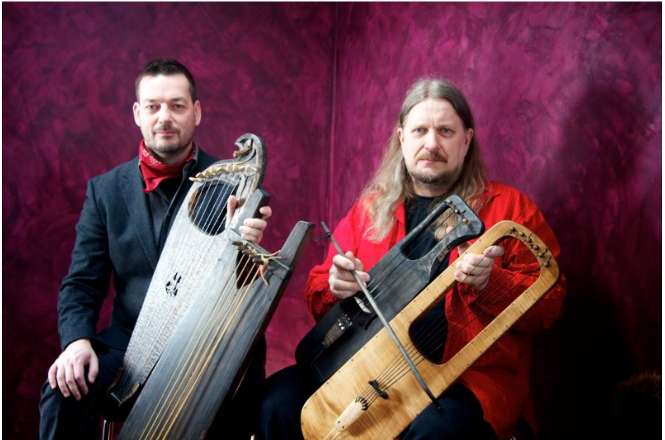
Das finnische Duo „Ontrei“

Am Montag, 7. März, ab 20.00 Uhr präsentiert das Duo „Ontrei“ finnischen Folk im Trauzimmer Marina Rünthe.