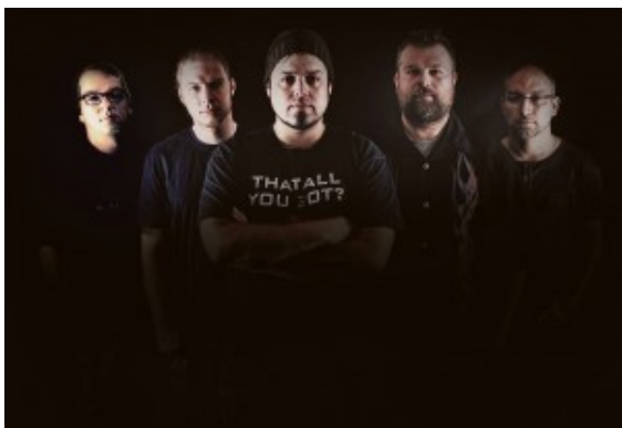
„Honeybadger“ aus Dortmund

Im Sternzeichen der Rockmusik steht der kommende Freitag, 28. Februar: Vier Bands aus der Region rocken sich durch den Abend. So gibt es Classic-, Heavy-, Death-, Stadion-, Glam- und Alternativerock von ambitionierten jungen Musikern und alten Szenehasen im Jugendzentrum Yellowstone zu hören.